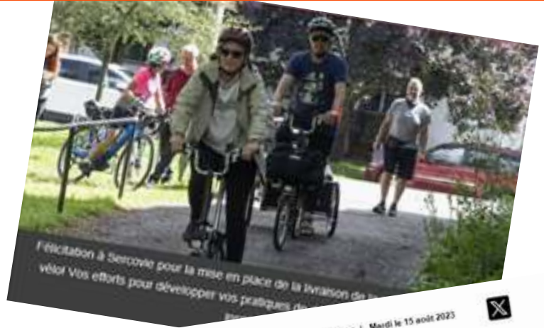
Félicitation à Sercovie pour la mise en place de la livraison de vélo. Vos efforts pour développer vos pratiques de... Accueil | Contactez-nous | Mardi le 15 août 2023

Entrevues à la radio, reportages à la télé et parutions dans les journaux... Le 50e de Sercovie a bien été représenté cette année.